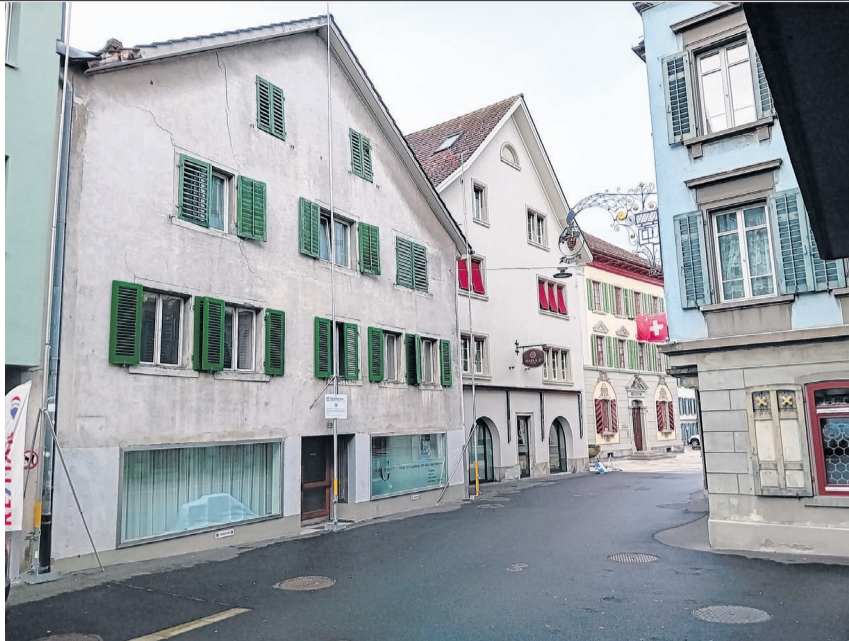
Am Haus der damaligen Bäckerei Schriber an der Marktstrasse in Lachen stehen aktuell Bauvisiere für einen Neubau, rechts das frühere Restaurant Traube.

Mit der gewandelten Stimmungslage zur Spitallandschaft im Kantonsrat könnte somit vielleicht tatsächlich einige Zeit nach meinen Vorstössen die Politik «Verantwortung übernehmen in der Spitalplanung». Eine überfällige, aber begrüssenswerte Entwicklung. Antoine Chaix, SP-Kantonsrat, Einsiedeln