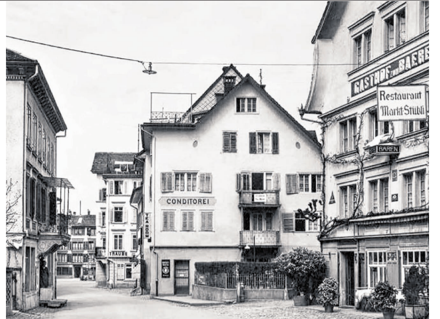
In der Mitte die damalige Conditorei Schmid, ganz links die Eisenhandlung Grüniger, rechts der Gasthof zum Bären und ganz rechts noch das Schild zum Restaurant Markt-Stübli.